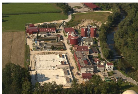
CČN pred začetkom nadgradnje v letu 2013 in po nadgradnji v letu 2016.